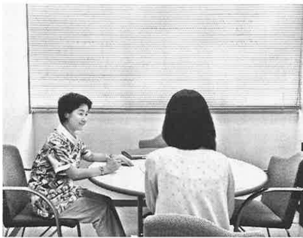
広島大学保健管理センターにて