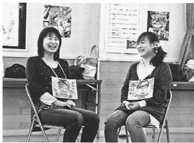
あなたのこぼれるような微笑みに惹かれます

また1日目のクラス実施の冒頭で表2に示すグランドルールを説明し、心のありようを安心して表出できるように参加者全員が守り合うことを確認した。1日目は自分と仲間の素敵なところを認め合いながら、生き方のモデルを描くことで、一人の女性として何を求めて生きているのかを再確認し、自己効力感、自尊心を回復・強化することに焦点を定めた。その結果1日目の最後に書いた「今日の自分宛てのラブレター」で母親Aは、「はじめまして、リフレッシュマママクラスに参加して、最初は不安だったけれど、い