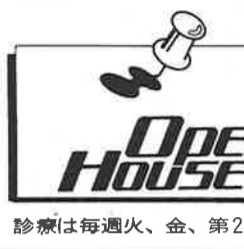
診療は毎週火、金、第2土曜

性教育が「不適切」とされ、学校で学外講師などを通して学ぶ機会を持っていないとすれば、家庭への期待は大きくなり、不安、緊急避妊などさまざまな相談がある中で、時々大人からの電話があります。親御さんからの相談です。 *** 思春期・FPホットラインには、子どもたちからの体の成長・変化、月経不順、性感染症、妊娠不安、緊急避妊などさまざまな相談がある中で、時々大人からの電話があります。親御さんからの相談です。